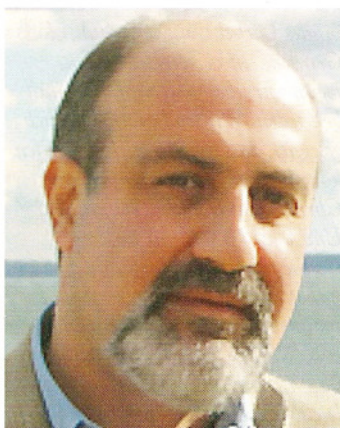
Nassim Nicholas Taleb beschreibt Unwahrscheinliches.

Neben dem Bankrott des Truthahns zeigt Taleb noch eine zweite Kurve (siehe Grafiken): Den Aktienkurs der Bank IndyMac. Er steht stellvertretend für weitere tausend Finanzhäuser, die gegen überraschende Ereignisse gewettet haben, und gemäss Taleb mehr verloren haben, als jemals in der Geschichte des Bankwesens verdient wurde. Trotzdem erhalten die Banker ihre Boni weiterhin. Und es sieht so aus, als müssten die Steuerzahler die Rechnungen bezahlen. Der Bestseller von Nassim Taleb «Der schwarze Schwan» liegt in Deutsch vor. Die Theorie über «die Macht