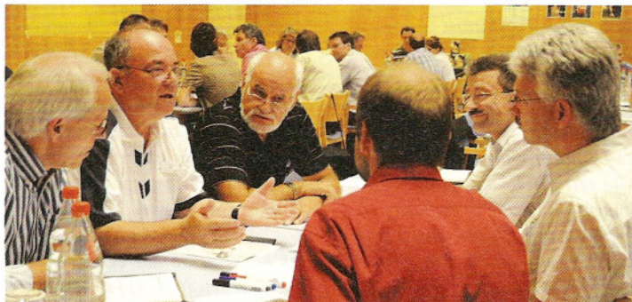
Ein heikles Thema: Konferenzteilnehmer diskutieren auf St. Chrischona ihre Erfahrungen rund um die Finanzen.